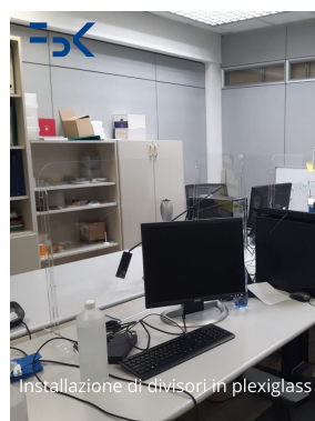
Installation of dividers in plexiglass