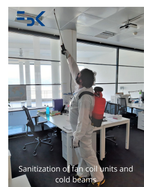
Sanitization of desks, units and cold beams

FBK continua a mantenere alto il livello di attenzione e cura degli ambienti e delle persone.