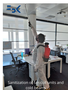
Sanitization of fan coil units and cold beams

FBK keeps maintaining a high level of attention and care for its spaces and workers.