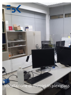
Installation of plexiglass