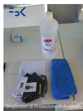
Measures of Protection Individual