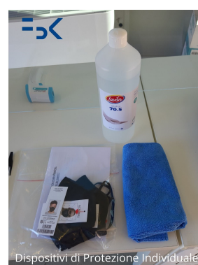
Disposizione di Protezione Individuale