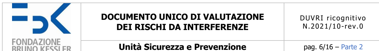
TABELLA 2C) Rischi specifici presenti nell'ambiente di lavoro (FBK) e incidenti sulle attività oggetto dell'appalto (RISCHI AMBIENTALI FBK)

I rischi specifici FBK potrebbero rivelarsi tali anche per l'Appaltatore nell'esecuzione degli interventi previsti dal contratto